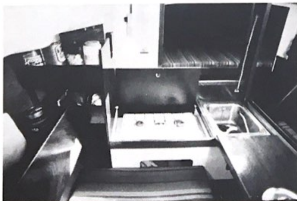
Zeer kleine kombuis.